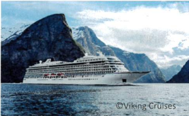
※写真は同型の他船です

2018年に7月に同社の第5船目として就航し、極東クルーズの終着地点として東京港に初入港します。 晴海客船ターミナル3階送迎デッキから間近にご覧いただけます。晴海ふ頭で初入港を歓迎しましょう！